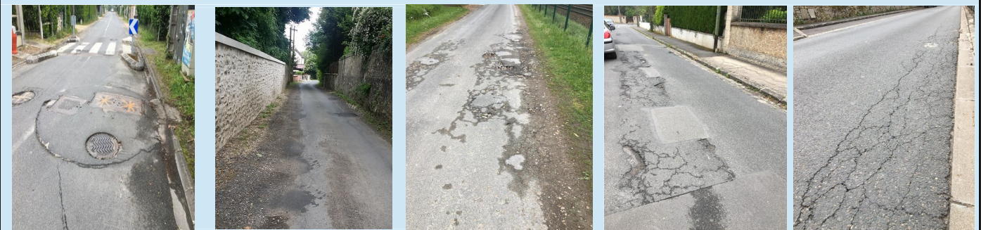
Rue de la Justice