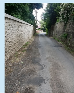
Rue du Jard