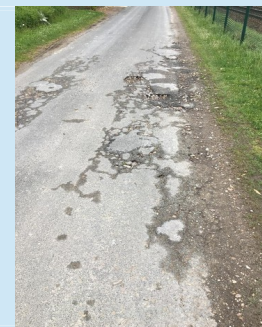
Rue de la Justice