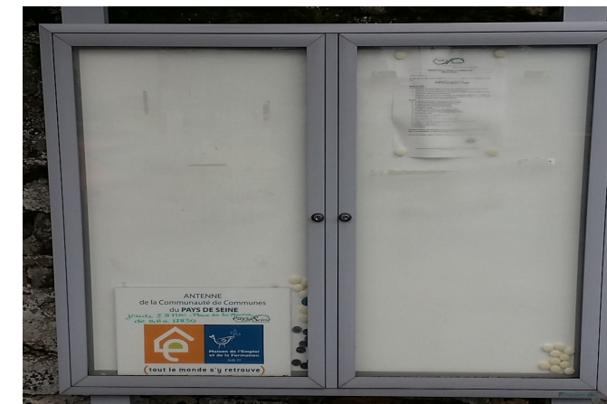
Informations de l'intercommunalité !

Enfin, pour terminer, que penser des conseillers communautaires chartrettois de la majorité, n'exprimant aucune opinion, les yeux baissés et votant sans sourciller tout ce qui leur est soumis.